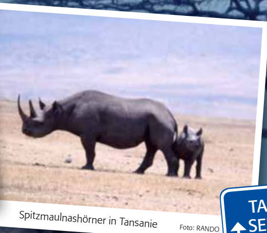
Spitzmaulnashörner in Tansanie