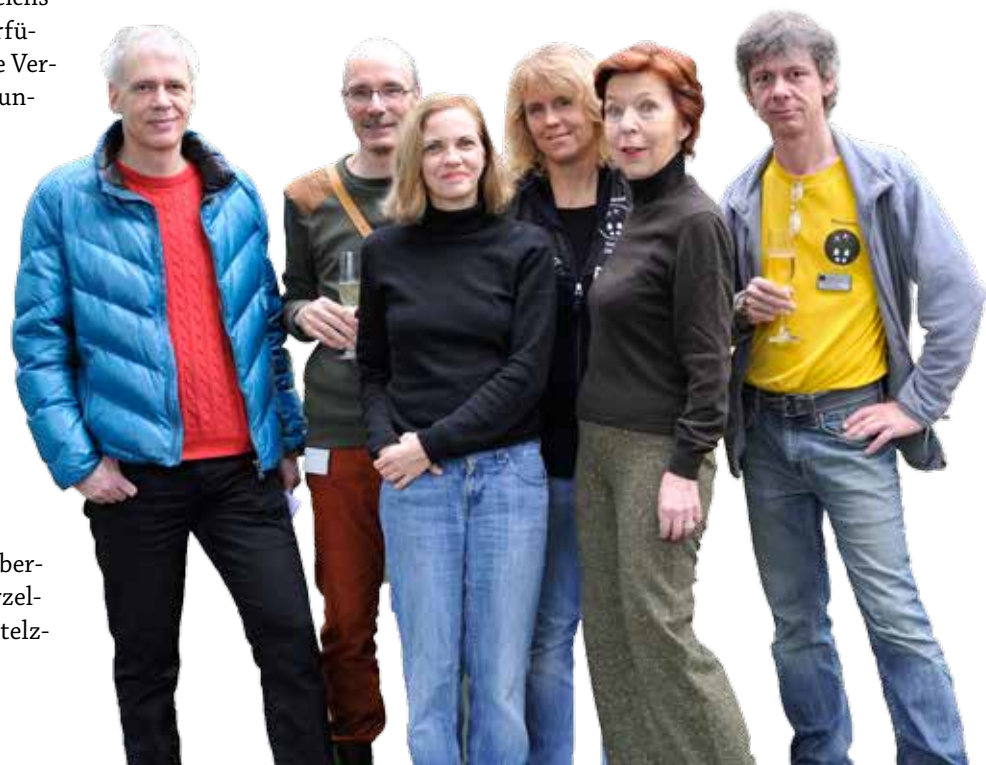
Das Team bei der Eröffnung.

bäume und die sich zwischen den Wurzeln sammelnden Sedimente sind Lebensraum und Kinderstube zahlreicher Tierarten. Mangroven sind wichtige Laich- und Aufwuchsgebiete für Fische, Krebse und Garnelen, von denen einige später Korallenriffe oder andere Ökosysteme der Küstengewässer bevölkern. Mangroven bieten aus-