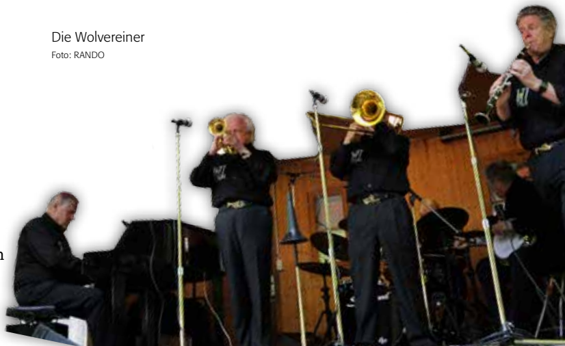
Die Wolveriner

Der Tierparkverein dankt der Wolverines Jazzband für ihre jahrelange Mitwirkung und freut sich auf viele Gäste zu diesem grossartigen Erlebnis. ■