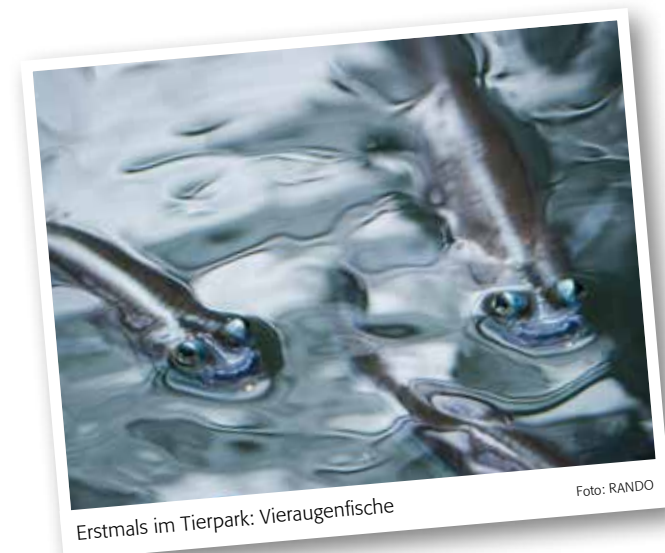
Erstmals im Tierpark: Vieraugenfische

Das Wetter war nicht gerade «stimmig» am 31. Januar 2013 als die Wolfsanlage eröffnet wurde. Doch das schreckte die anwesenden Sponsoren, Fans und die Leute der Presse glücklicherweise nicht ab, sich zu vergewissern, dass die Anlage artgerecht gebaut und gestaltet wurde. Petrus meinte es auch an der Jazzmatinée, welche am 28. April 2013 stattfand, nicht wirklich gut mit uns. Trotzdem verfolgten