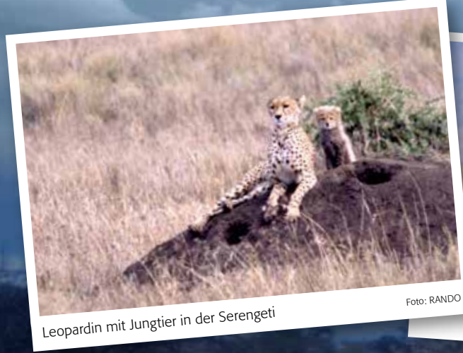
Leopardin mit Jungtier in der Serengeti