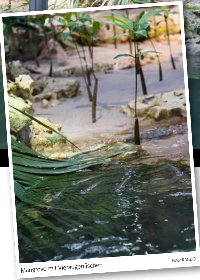
Mangrove mit Vieraugenfischen