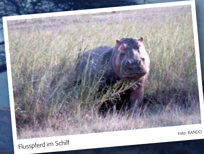
Flusspferd im Schilf